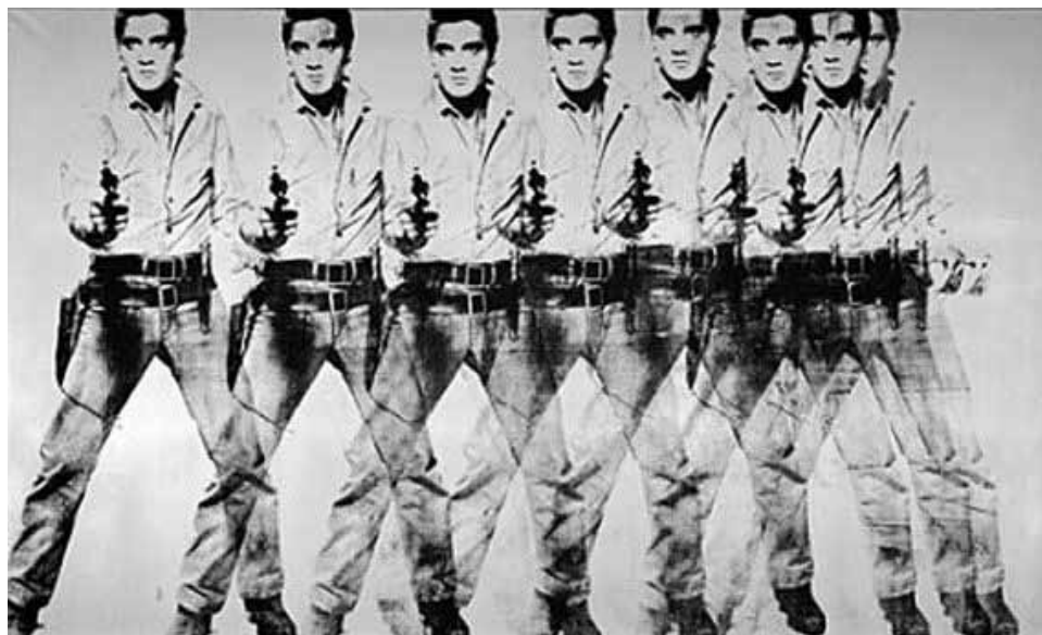
■ Elvis Presley démultiplié jusqu'à en perdre son identité dans le tableau d'Andy Warhol, Eight Elvises 1963